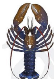
8,7 cm de l'arrière des Orbites jusqu'à la bordure distale céphalothoracique

Celui-ci a-t-il eu des remords ou s'était-il déjà attaché à moi ?