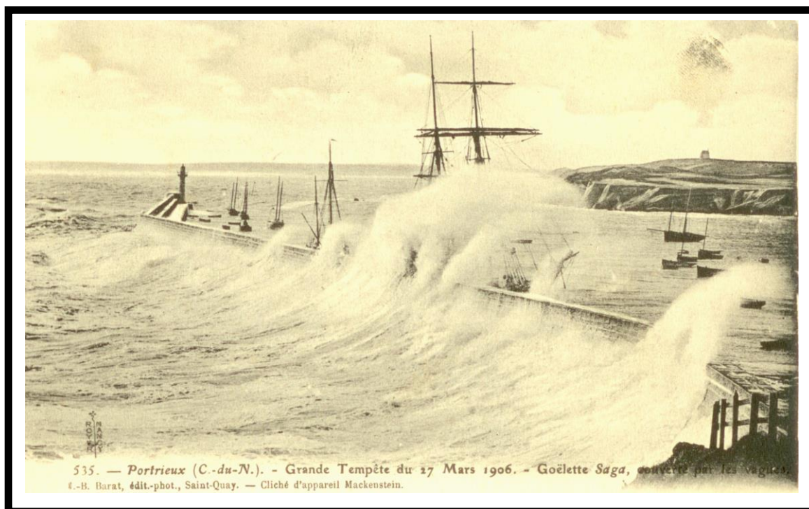
Une tempête de 1906

ACCASTILLAGE - DÉPÔT-VENTE NAUTIQUE REMORQUE - MOTEUR - DÉCLASSÉ - FIN DE SÉRIES