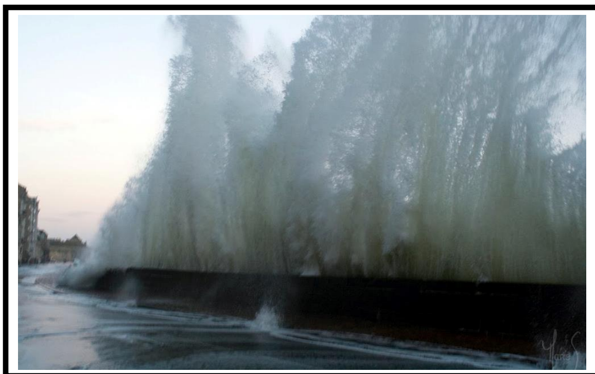
Souvenir de cet hiver

ACCASTILLAGE - DÉPÔT-VENTE NAUTIQUE REMORQUE - MOTEUR - DÉCLASSÉ - FIN DE SÉRIES