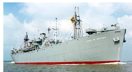
Liberty Ship SS John W. Brown

Le 30 Octobre 42, en Méditerranée, le U 559 est attaqué par 5 escorteurs anglais. Après 9 heures de grenadage il fait surface, le HMS "Petard" l'aborde et une équipe s'empare d'une machine Enigma et des clés de "Medusa".