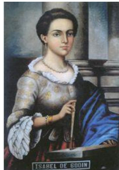
Isabel Godin des Odonnais

Pendant ces 18 ans ils feront des demandes de passeports auprès de l'Espagne, du Portugal et de la France mais toutes leurs demandes se perdent, ou n'arrivent pas, ou sont refusées pour de futilles prétextes.