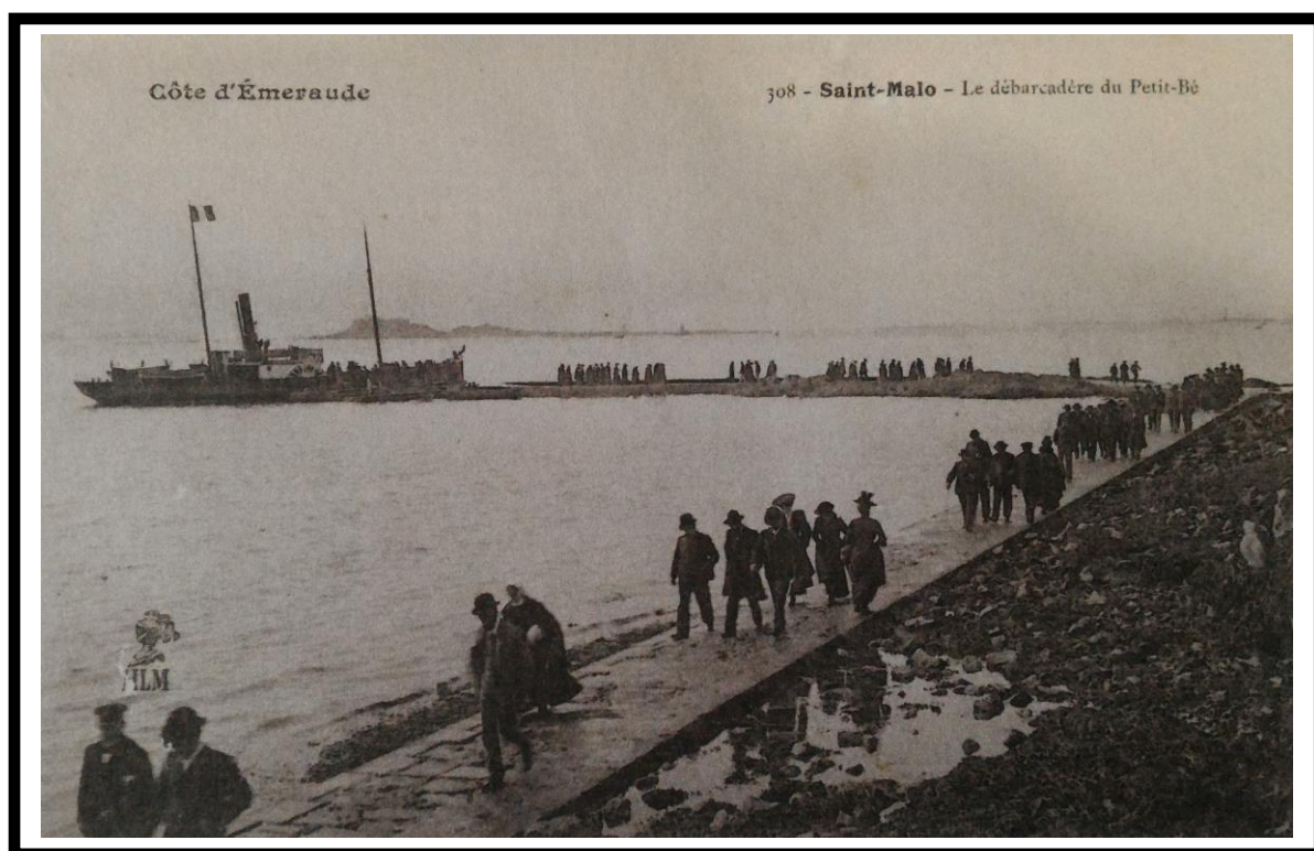
Le débarcadère du Petit-Bé